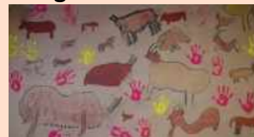
Classe de CE2